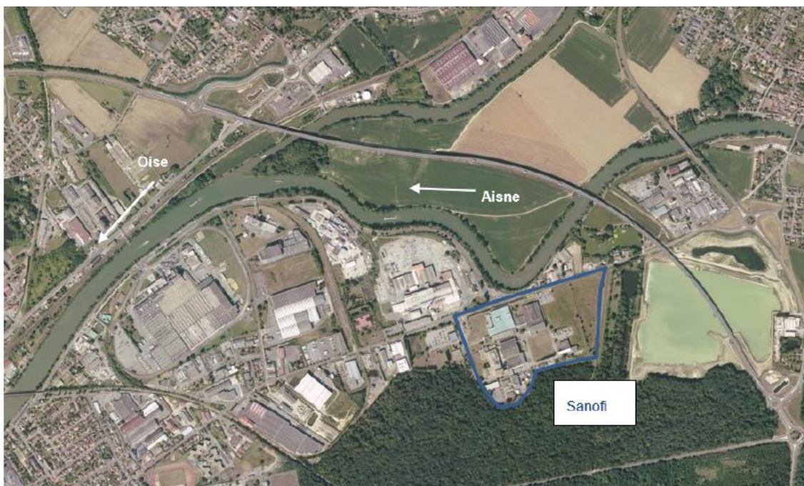
Localisation du projet entouré bleu

Le projet, présenté par la société Opella Healthcare International SAS (ex Sanofi), consiste à renforcer le système d'endiguement de son site industriel de Compiègne et Choisy-au-Bac, dans le département de l'Oise, pour le protéger d'une crue centennale de l'Aisne et de l'Oise.